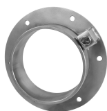
Piesa de trecere SLF RS BG™